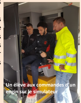
Un élève aux commandes d'un engin sur le simulateur

Pôle formation TP de Mallemort T. 04 90 59 42 05 www.poleformation-tp.fr